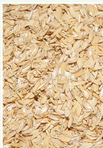
Cascarilla de arroz

gramoFLAKES® es un producto derivado de la cascarilla de arroz, un subproducto de la industria agroalimentaria, que tras un proceso térmico-mecánico, desarrollado por Gramoflor, se convierte en una materia prima alternativa, homogénea y estable, de gran valor para su utilización en sustratos de cultivo.